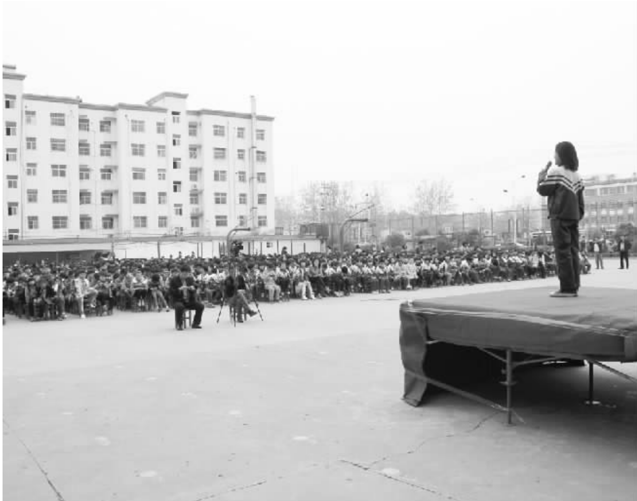
为进一步引导广大青少年正确理解“中国梦”内涵,将个人理想与祖国发展紧密结合起来,放飞青春梦想,近日项城市各学校纷纷举办了“我的梦·中国梦”演讲比赛。图为4月11日,该市蓝天小学演讲比赛现场,同学们慷慨激昂、声情并茂地描绘着自己的梦想,勾画着中华民族伟大复兴的中国梦。