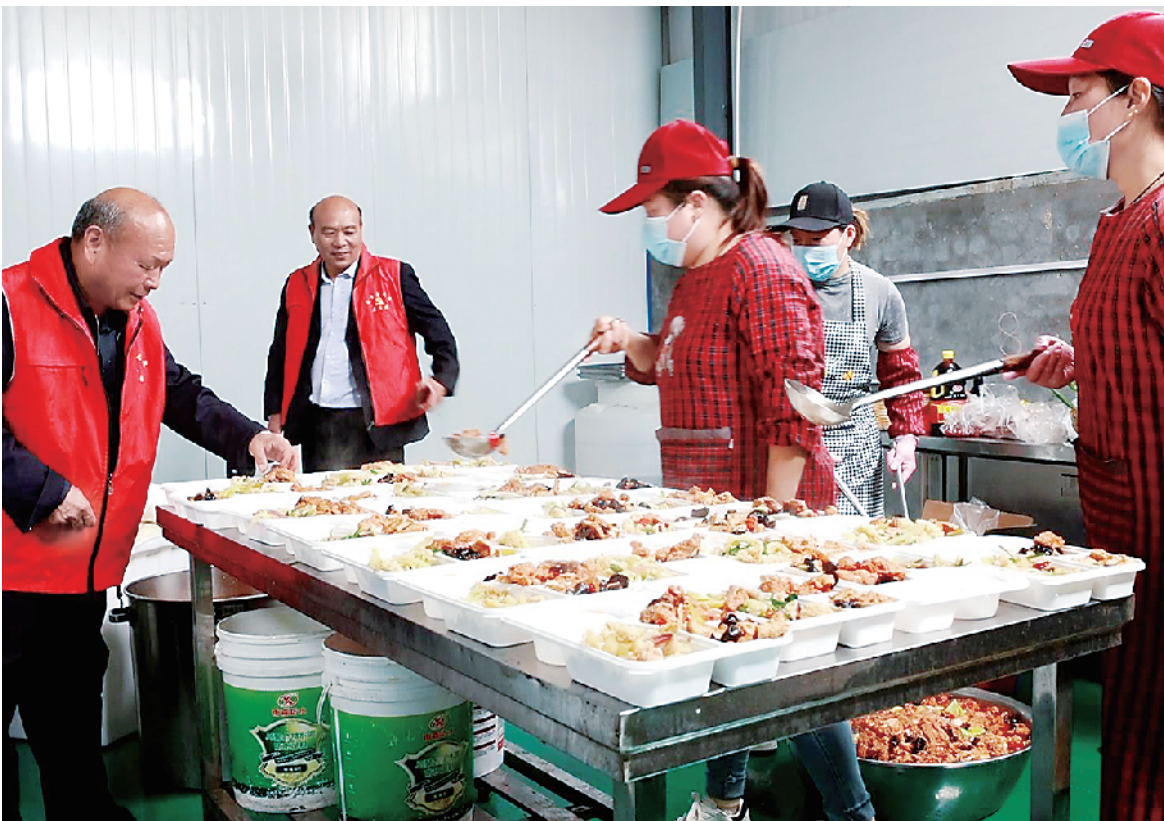
盛营大食堂菜品丰富。

“盛营行政村兴办大食堂的目的是让村民从过去的讲排场、比气派，转变为现在的比文化、比家风，不断提升村民素养。”三店镇相关负责人表示，下一步，三店镇将以“文明幸福星”创建为契机，充分发挥村红白理事会作用，在更多行政村开办大食堂，大力推动移风易俗，选树婚事简办、喜事新办典型，引导群众以实际行动营造勤俭节约的氛围，以文明乡风助力乡村振兴。②18