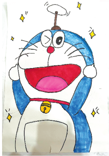
小记者：王悦果 三（2）班 (辅导老师：何萌)