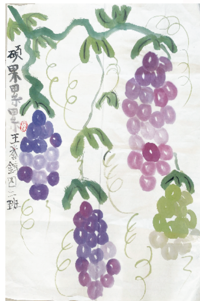
小记者：王誉铮 四（2）班 (辅导老师：胡佳佳)