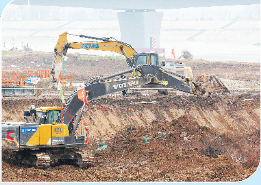
随着周口港中心港区中心作业区工程（一期）的开工，沙颍河周口至省界航道提升工程备受关注，目前“四升三”项目已全面施工。图为3月13日，在淮阳区郑埠口一线船闸改扩建项目退建堤防建设现场，工人们正在紧张施工。