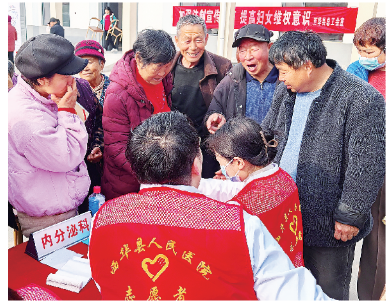
3月11日,春光明媚,西华县人民医院组织中医科、眼科、内分泌科、高血压科、神经内科的医护人员走进皮营乡牛营村开展义诊活动,以实际行动传承雷锋精神。

不少老人在享受到乡村大食堂带来的便利后,主动要求为村里的公益事业出力。七二村根据老人的特长,将他们编入生产队、副业队、卫生队等志愿服务队,分别负责集体自留地生产、村容村貌管理等工作。老人在发挥余热的时候,收获了满满的成就感。崔永振表示,未来,奉母镇将持续通过政策引导,让“孝”成为每一位村民的自觉行动和生活习惯,综合运用集中供养、社会托养、居家养老、亲情赡养、邻里助养、居家养老等多种方式,全方位保障老人的晚年生活,让奉母镇的孝贤之风越吹越盛,温暖每一位老人的心。