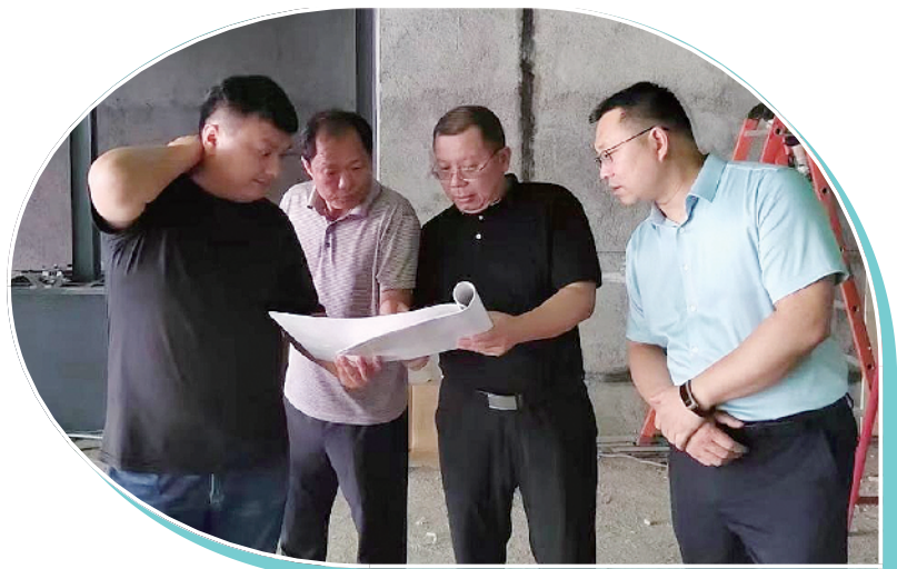
营业网点是银行工作的前沿哨所。近年来,农行沈丘县支行持续改善金融服务环境,提升服务质效,倾力打造人民满意的银行。图为近日,农行周口分行有关负责人到沈丘县支行查看营业网点改造情况。