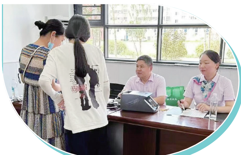
农行商水县支行践行“金融为民”理念,精心打造互联网场景,提高金融服务能力,为入学新生提供“一站式”金融服务。图为近日,该行业务骨干在某学校为师生及家长提供金融服务。