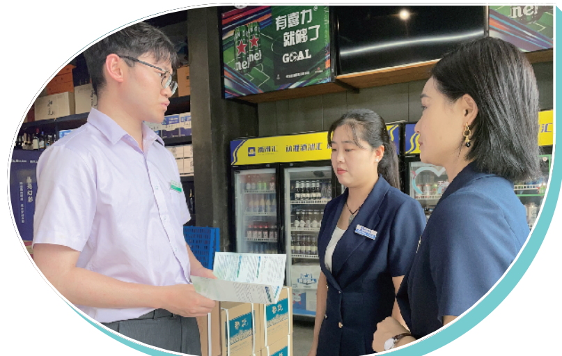
近日,农行周口分行充分发挥激发消费市场活力主力军作用,推广线上办卡业务,推出新客好礼、消费有奖等活动,进一步点燃群众消费热情。图为8月19日,农行周口莲花支行工作人员在酒洲汇商贸有限公司为客户讲解信用卡办理方法。