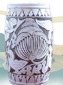
宋当阳峪窑白釉刻花罐