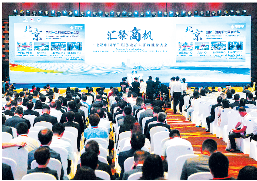
“投资中国年”服务业扩大开放推介大会在北京举行

名字重新命名。2013年8月,习近平总书记到沈阳黎明公司考察时,曾与“李志强班”职工亲切交流。近日,“李志强班”的8名职工代表给习近平总书记写信,汇报十年来在加强技术创新、推进航空发动机研制方面取得的成绩,表达为建设航空强国贡献力量的决心。