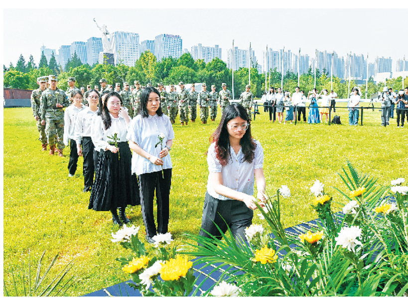
侵华日军南京大屠杀遇难同胞纪念馆举行九·三主题活动

葵”将于3日晚前后登陆台湾岛,逐渐靠近福建、广东沿海,我国东部海区及福建、广东等沿海风力大,台湾、福建和广东等地将有大到暴雨、局地大暴雨或特大暴雨。