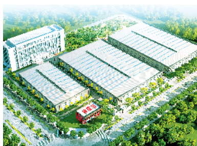
扶沟县苏友纺织年产25000吨化纤布项目