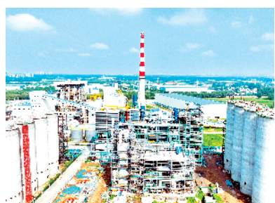
周口港口综合物流园区热电联产项目