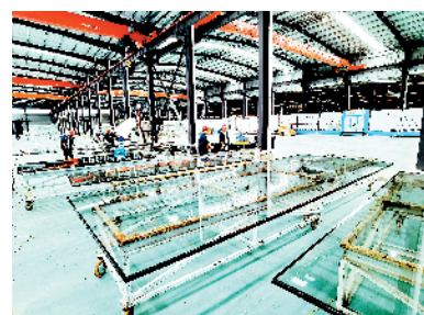
中玻玻璃年产100万平方米超大LOWE镀膜玻璃建设项目