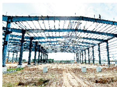
河南联塑年产8万吨塑料制品自动化生产项目