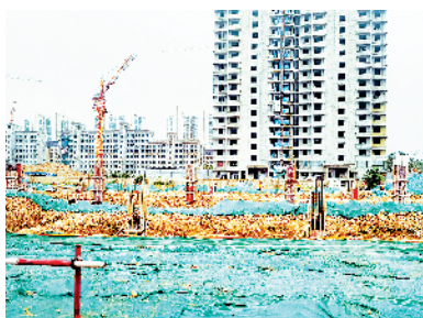
商水县达纺织20万锭纺纱产业园项目