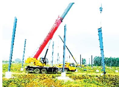
商水县中棉集团全产业链棉储棉纺产业化生产基地项目