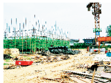
广药大健康产品系列饮品生产建设项目