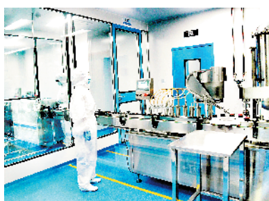
四方药业中试基地项目