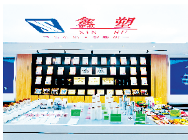
鑫塑新材料CPP膜建设项目