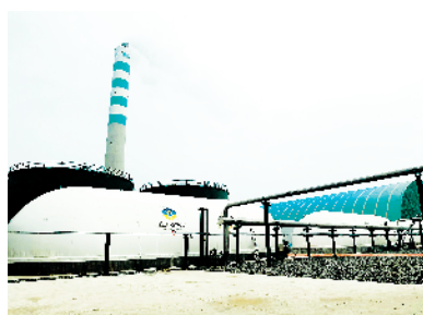
商水县农业废弃物综合利用生产天然气项目