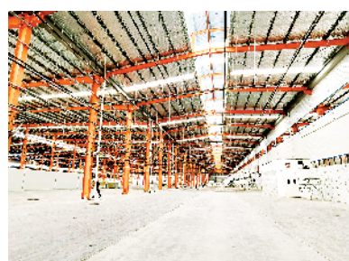
深圳光电全产业链项目