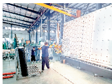
秦明玻璃年产200万片新型节能玻璃项目