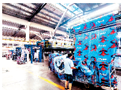
扶沟县东辰纺织科技有限公司年产8万吨家纺及服装面料项目

该项目购置智能化生产线4条,主要生产钢化玻璃、PVB夹胶玻璃、中空玻璃、节能LOW-E玻璃、镀膜玻璃、防火玻璃、夹丝夹胶玻璃、防爆玻璃、工艺玻璃等100多个品种。目前,智能化生产线设备调试完成,已投入使用。项目全部建成后,预计实现年销售收入2.5亿元,利税约3200万元。②2