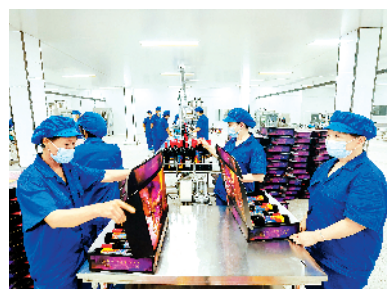
西华县红酒产业园建设项目