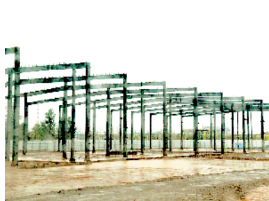
周口临港开发区冷链仓储物流园项目