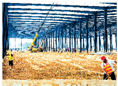
扶沟县华和纺织年产1000万米胆布项目