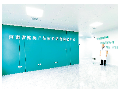
河南省鞋制品产品质量监督检验中心项目