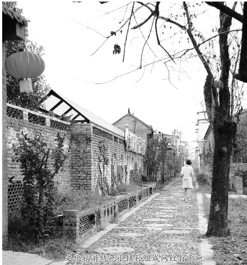
文化旅游特色小镇孙咀成网红打卡地

冬雨淅沥,漫步在川汇区沙颍河生态经济带孙咀村节点边,树叶金黄,微风一吹,翩翩飘落,远处阡陌纵横的农田与村庄相映成趣,耳旁萦绕着水浪、鸟鸣,鸟儿或飞、或走,千姿百态,为沙颍河增添别样的灵动与美丽。如此美景,难怪电视剧《颍河故事》曾在此取景。