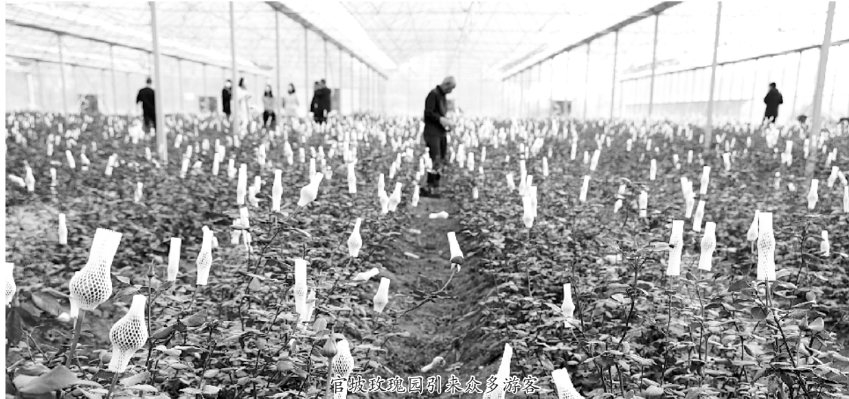
官坡玫瑰园引来众多游客

站在岸边,抬眼望,湾道内流淌的沙河水,正顺岸途经官坡行政村。此处曾是古代官兵放养马儿和休息之地,故名官坡。官坡行政村辖官坡、黄套楼2个自然村,总人口1960人,总面积4平方公里,耕地面积800亩,2020年被评为全国文明村。