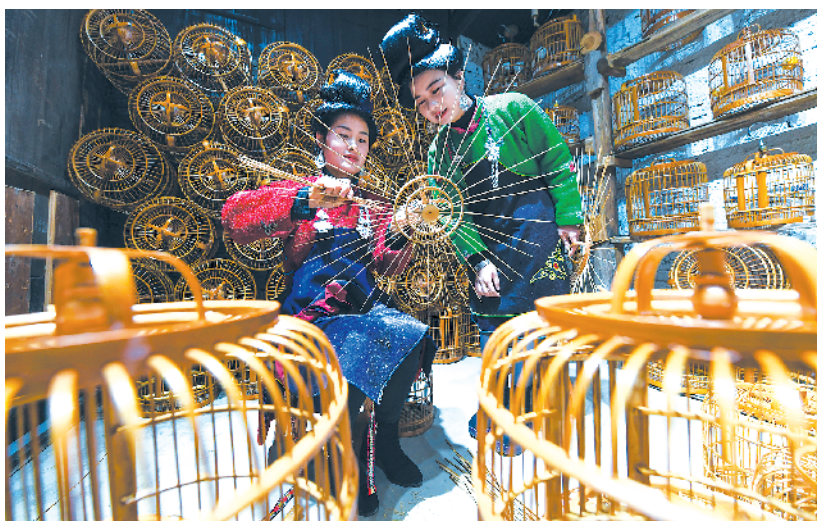
贵州丹寨:非遗老技艺 焕发新生机

在贵州省丹寨县龙溪镇卡拉村的鸟笼文创工坊,苗族手工艺人在编制鸟笼(11月16日摄)。