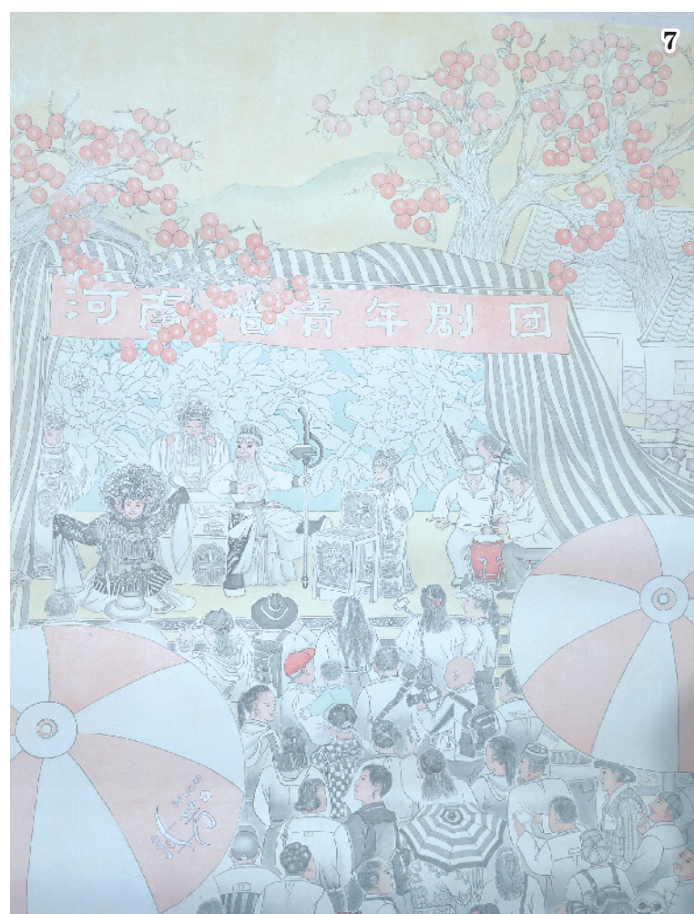
图1:岳巧玲在王冠军工作室深造。(岳巧玲 供图) 图2:记者采访岳巧玲的老师——淮阳区终身美协主席范景恩(中)。 图3:岳巧玲临摹《维摩演教图》有感。 图4:岳巧玲(左)与王艺千(王健)老师合影。(岳巧玲 供图) 图5:岳巧玲展示其临摹的《维摩演教图》。 图6:岳巧玲临摹的《维摩演教图》局部细节。 图7:岳巧玲作品《乡戏》局部。 图8:岳巧玲与丈夫吴磊展示其作品《乡戏》。 图9:岳巧玲作品《今天是个好日子》局部。