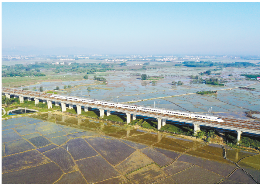
飞驰,在希望的田野上

哈恰图良表示,建交30年来,亚中两国各领域合作成果丰硕。亚方高度重视中国取得的发展进步和发挥的国际作用。我愿同习近平主席一道努力,实现亚中友好合作关系持续稳定发展,造福两国人民。